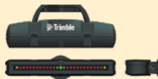
Spoljni svetlosni navigator